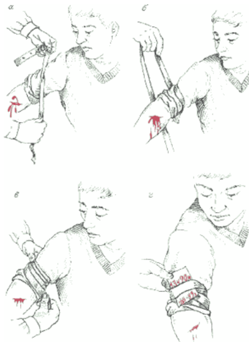
Рис. 13. Техника наложения резинового жгута:

а - растягивание жгута; б - наложение жгута с постоянным его растяжением; в - витки жгута ложатся один к другому; г - записка с указанием времени наложения.